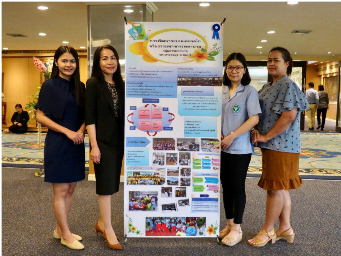
กลุ่มงานการพยาบาล โรงพยาบาลบางละมุง