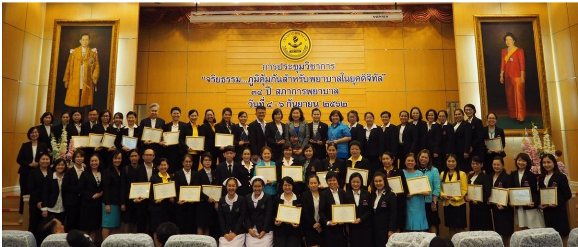
รางวัลหน่วยงานที่พัฒนาระบบและกลไกจริยธรรมขององค์กรพยาบาล/สถาบันการศึกษาพยาบาล และการพัฒนาระบบและกลไกโดยการบูรณาการหลักปรัชญาของเศรษฐกิจพอเพียงสู่การบริการพยาบาล/การจัดการศึกษาพยาบาล