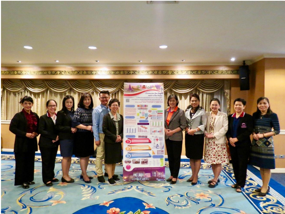
ฝ่ายการพยาบาล โรงพยาบาลมหาราชนครเชียงใหม่