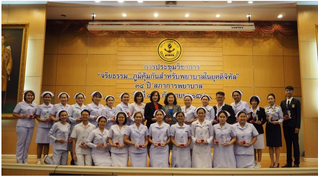
รางวัลพยาบาลบำเพ็ญความดีในโครงการธนาคารความดี